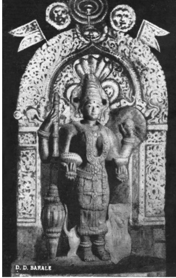
मूल मूर्तीचे छायाचित्र

भारतात हिंदू धर्मात द्वादश शक्तीपीठे आहेत त्यातील एक शक्तीपीठ म्हणजे करवीर क्षेत्राची 'अंबाबाई' ही होय. हिचे वाहन सिंह आहे. तिथे श्रीचक्र, चौसष्ट योगिनी व मातृलिंग आहे. मंदिरातील दोन्ही मूर्ती (सरस्वती व काली) याही दूर्गा, महिषासूर मर्दिनीच्या मूर्ती आहेत. ही तिरूपती बालाजीची पत्नी पद्मावती ही भक्तांची दिशाभूल आहे.